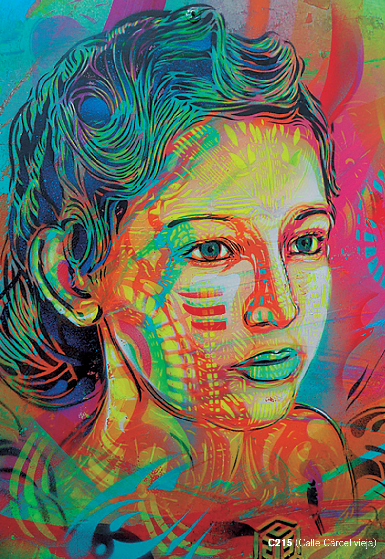
C215 (Calle Cárcel vieja)

Avant Garde Tudela es una muestra internacional de muralismo contemporáneo organizada por el Departamento de Cultura del Ayuntamiento de Tudela