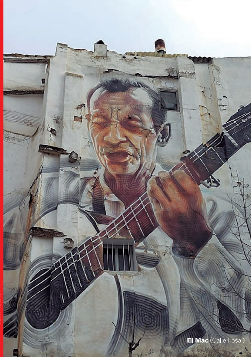
El Mac (Calle Fosal)