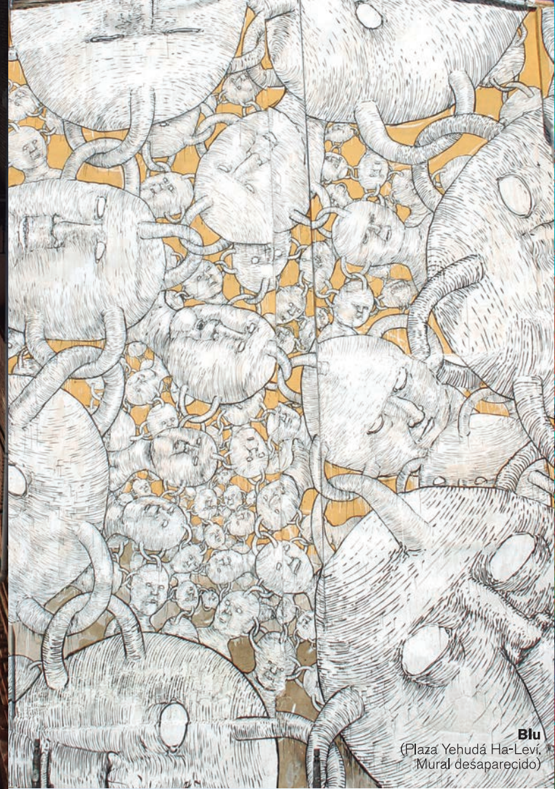
Blu (Plaza Yehudá Ha-Leví, Mural desaparecido)

Avant Garde Tudela Muestra Internacional de Muralismo Contemporáneo